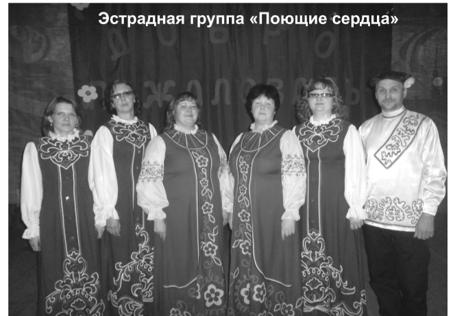
Эстрадная группа «Поющие сердца»

А за круглым столом «У самовара» собрались представительницы золотого возраста. Звучали шутки-прибаутки, лились песни, звучали воспоминания. Женщины-матери, а теперь уже и бабушки рассказывали захватывающие истории о своих детях, о приключениях своих внуков, делились