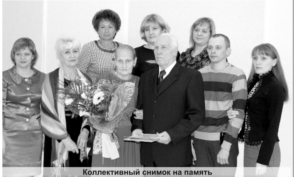
Коллективный снимок на память