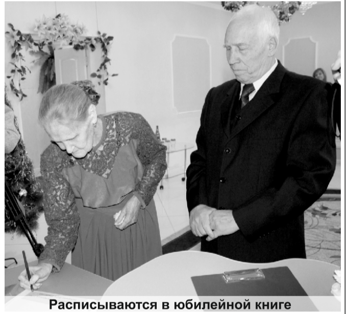
Расписываются в юбилейной книге