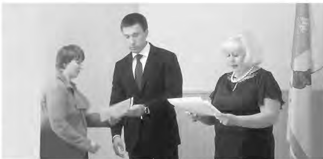
Министр Алексей Пьянков вручает документы на бесплатный земельный участок.

– МУГИСО максимально оперативно отреагировало на сложившуюся экономическую ситуацию, запустив ряд антикризисных мер. Так, в числе стабилизирующих мероприятий ведомством утвержден план по обеспечению устойчивого развития и повышения эффективности деятельности предприятий госсектора Свердловской области, а также предприятий агропромышленного комплекса области.