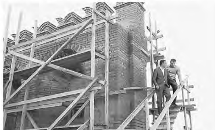
Специалисты МУГИСО контролируют процесс реставрации в Верхотурье.