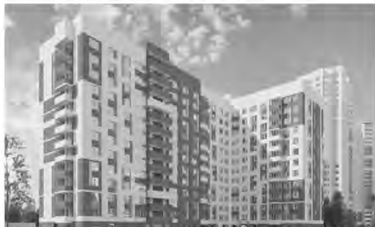
Сегодня в Свердловской области действует пилотный проект первого ЖСК «Альянс», для которого уже согласован эскизный проект дома.

Отмечу, что в Свердловской области за 2014 год и январь-март 2015 года специалистами ведомства возбуждено 88 дел об административных правонарушениях. В результате более 3,5 миллиона рублей административных штрафов было наложено по протоколам МУГИСО за нарушения в сфере охраны объектов культурного наследия.