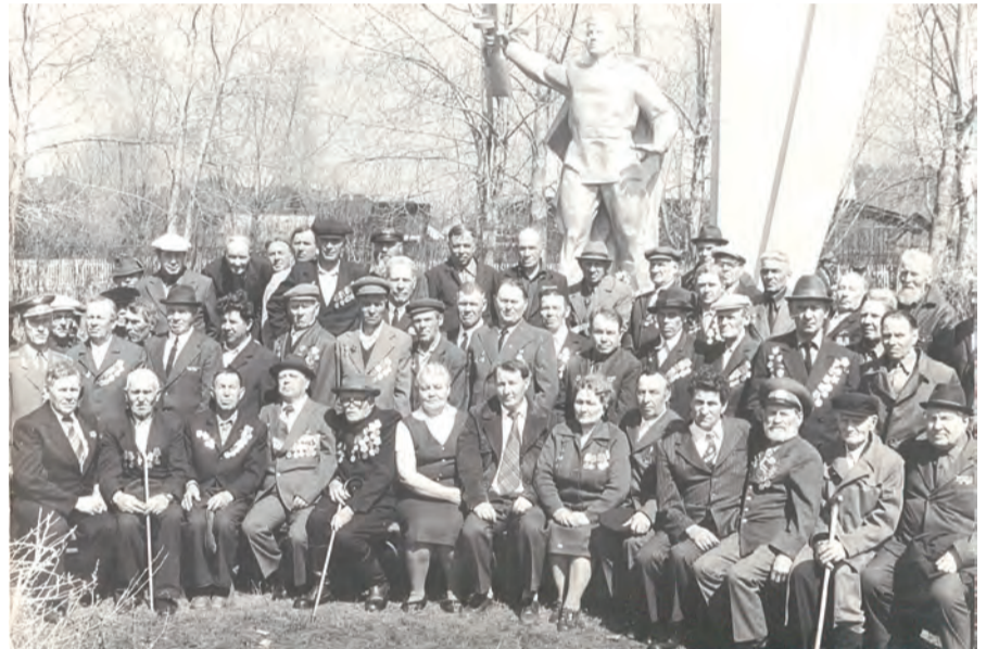
Ветераны Великой Отечественной войны у обелиска. 1982 год.