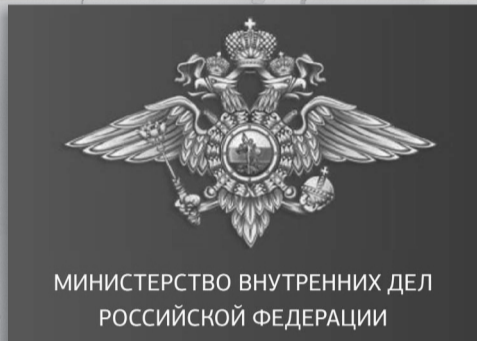
МИНИСТЕРСТВО ВНУТРЕННИХ ДЕЛ РОССИЙСКОЙ ФЕДЕРАЦИИ