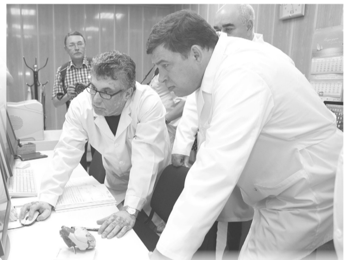
Львиная доля в новом бюджете губернатором Евгением Куйвашевым отводится проблемам медицины и увеличения продолжительности жизни уральцев.

долю составят расходы на образование: в 2014 году они превысят 45 млрд. рублей или 25% всех расходов. На здравоохранение направят почти 40 млрд. рублей. На социальную политику – более 32 млрд. рублей.