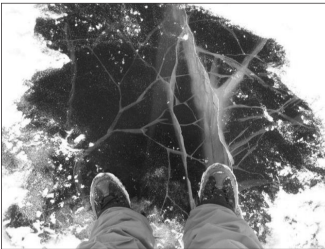
льду запрещено, все игры заканчиваются трагично.

Сотрудники МЧС обращаются к взрослым. Проведите дополнительные беседы с детьми об опасности нахождения на льду. Гулять, играть на тонком