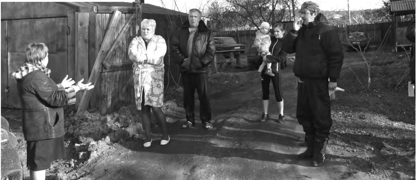
Собрание с жильцами дома по ул. Советская, 13 по вопросам благоустройства состоялось еще в апреле

По результатам рассмотрения поддержано 80 обращений, в том числе, по 34 решено