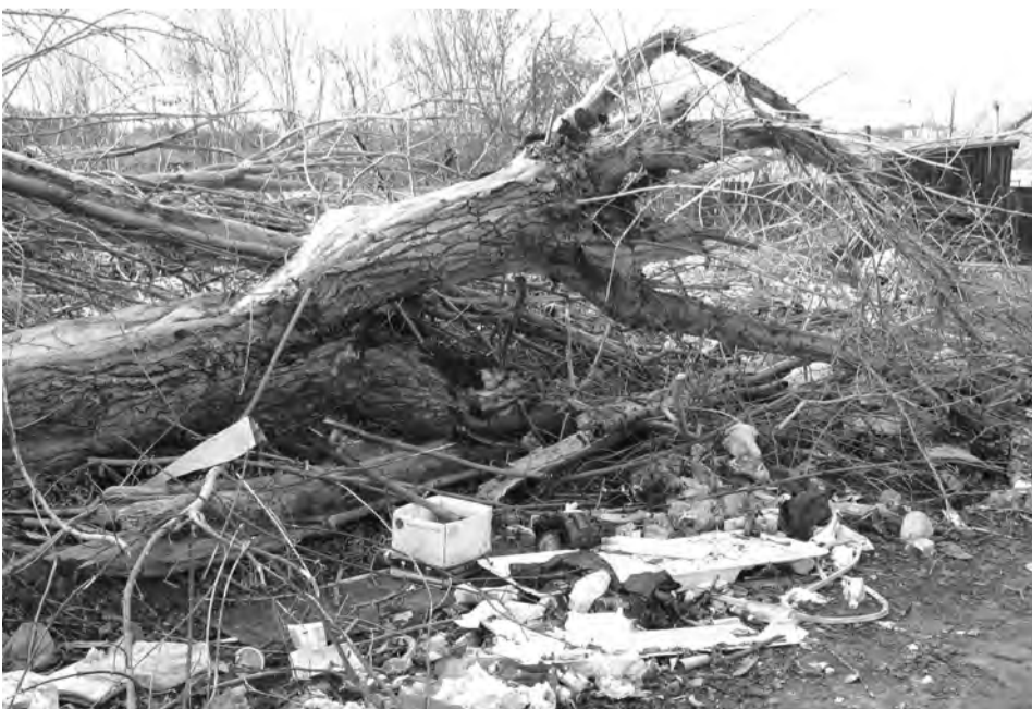
Свалка не санкционирована. Того, кто понесет и повезет сюда мусор ждет штраф от 3 до 5 тыс. руб.