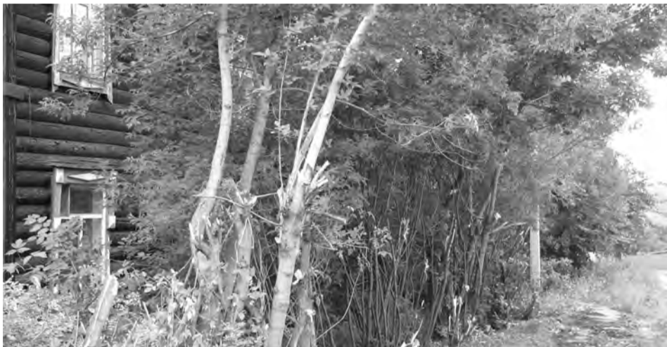
Кустарники вырубали, теперь и тротуар видно...

Работе по обращениям граждан в первом полугодии 2015 года и был посвящен один из вопросов расширенного аппаратного совещания в администрации ТГО