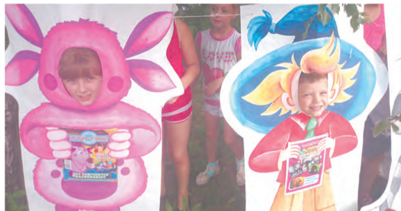
Фотоакция «Улыбки наших читателей»