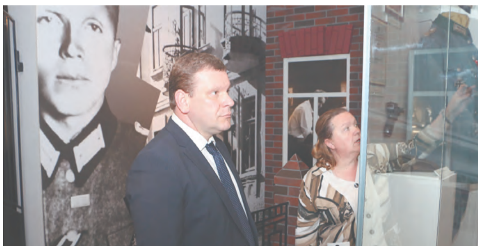
«Я с удовольствием побывал в музее...»