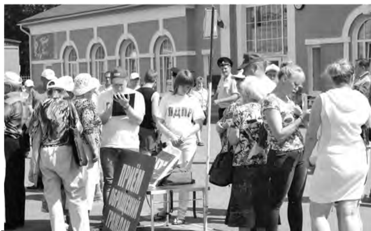
Агитпоезд ЛДПР стартовал из Москвы 22 мая, а вернется лишь 11 июня. В программе путешествия 9 регионов и более 300 остановок-встреч с местными жителями. Главная задача команды ЛДПР – сбор жалоб и наказов избирателей.

подкатил агитпоезд, состоящий из более чем 20 вагонов. О том, что в поезде нет самого Жириновского, не афишировали, похоже, побоявшись, что народ и вовсе не соберется. И сей факт вызвал большее разочарование. Хотели посмотреть на самого Жириновского, удостовериться, так сказать, что он все еще живой, а пришлось слушать депутатов Госдумы каких-то там регионов, которых мы не то что в глаза не видели, а даже и не слышали их имена. Говорили, как позаученному – о коррупции, о защите малого и среднего бизнеса, о высоких тарифах на услуги ЖКХ и газ, рассказали всю «правду» о деле «Оборонсервиса», Сердюкове и блондинке Васильевой, о плохих дорогах и аварийном жилье, о том, что Крым наш... Действующие депутаты Госдумы от ЛДПР обличали и обличали, но так и не сказали, каких результатов они добились, как защитили электорат от антинародных законов, чиновников-коррупционеров, что сделали для своих регионов, сидя в мягких креслах в Москве. А это очень хотелось бы услышать, потому что агитационных обещаний мы нае-