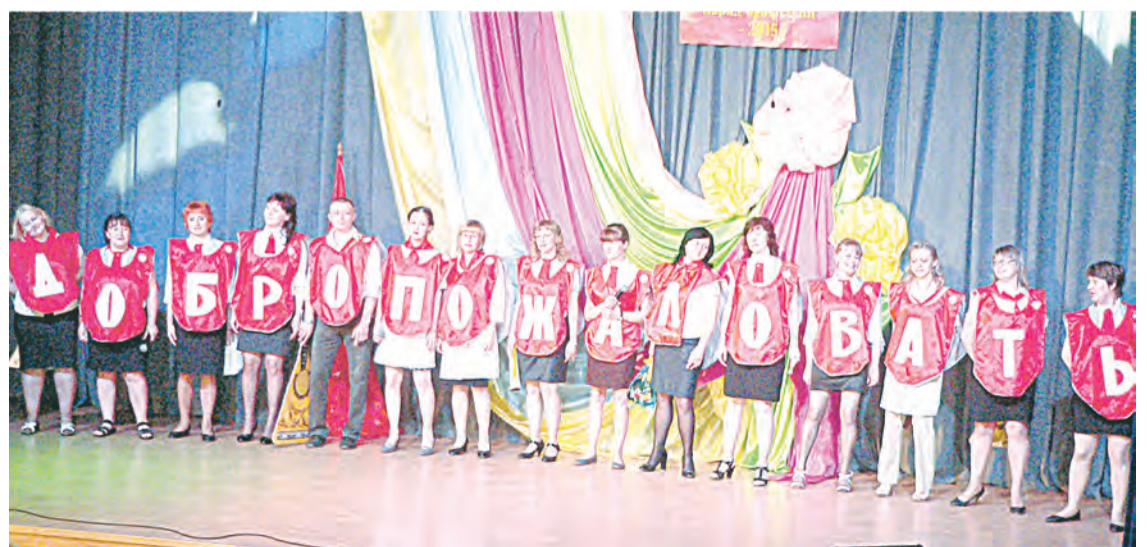
«Сердечный санаторий» приглашает...