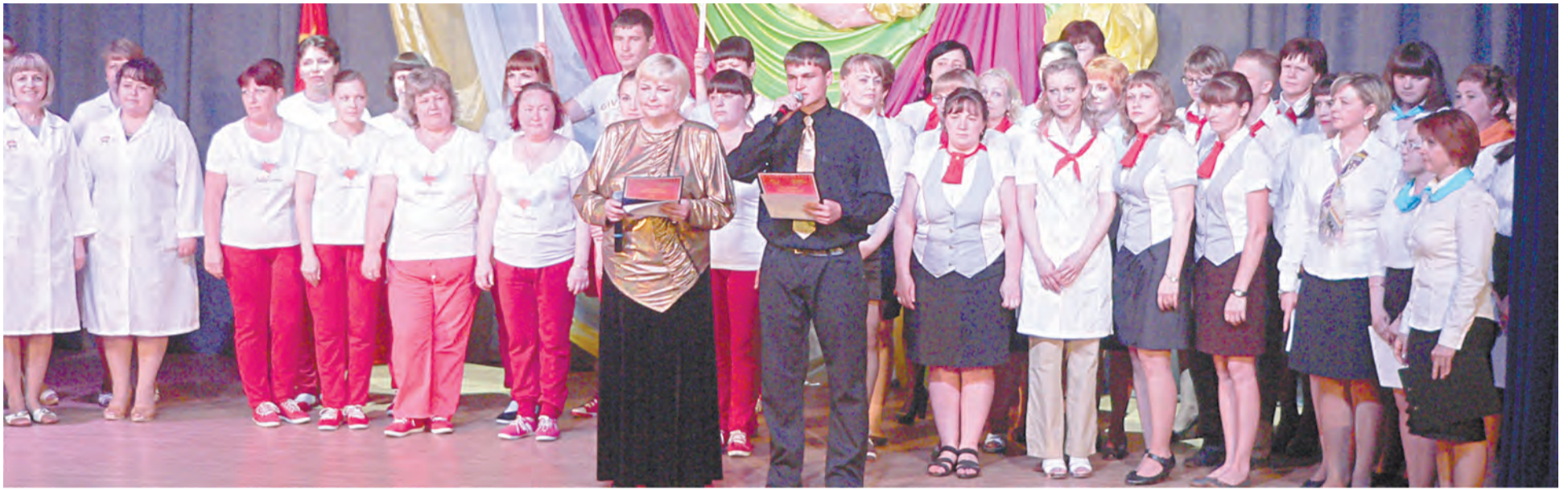
Все команды на сцене, к Параду профессий - готовы!

Воскресенье, 7 июня, РИКДЦ «Юбилейный». Сюда на районный смотр-конкурс творческих трудовых коллективов «ПАРАД ПРОФЕССИЙ-2015», который проходит под девизом «СЛАВИМ ЧЕЛОВЕКА ТРУДА», прибыли четыре команды.