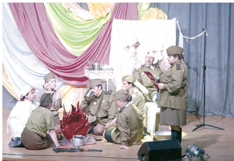
Фронтовой госпиталь - сколько он вернул в строй (команда ЦРБ)