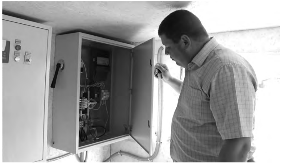
Стоимость одного кубического метра за воду с 1 июля составит 11,34.