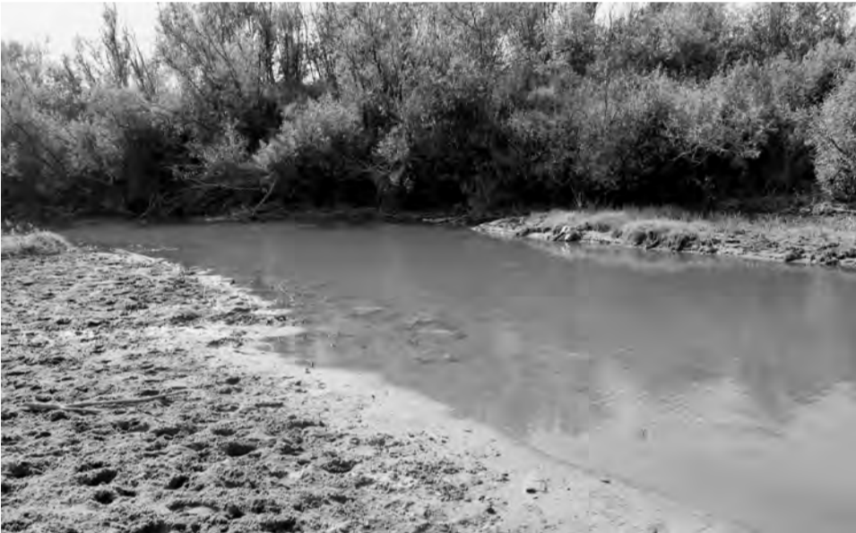
Воды здесь по колено, кажется, негде утонуть...