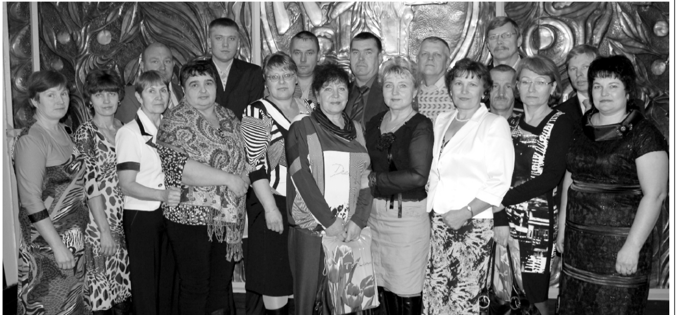
Делегация ЗАО «Талицкое»