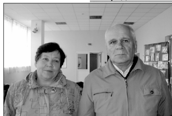
Представители династии Крошкиных

дорогие ветераны, желаем вам здоровья и побольше радости и любви окружающих вас людей.