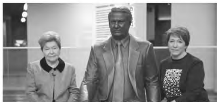
Наина Ельцина и Татьяна Юмашева (дочь): Мы закладываем новую традицию уважительного отношения к президентам, покинувшим свой пост.