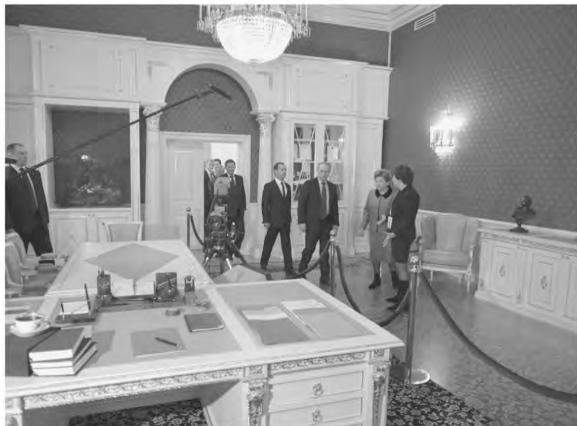
Самый удивительный экспонат – рабочий кабинет первого Президента России, обстановка которого – от письменного стола до штандарта – перенесена из Кремля в музейное пространство.