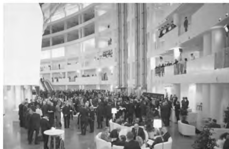
В центре будет библиотека, собрание архивных документов и площадка для открытых мероприятий, конференций, встреч.