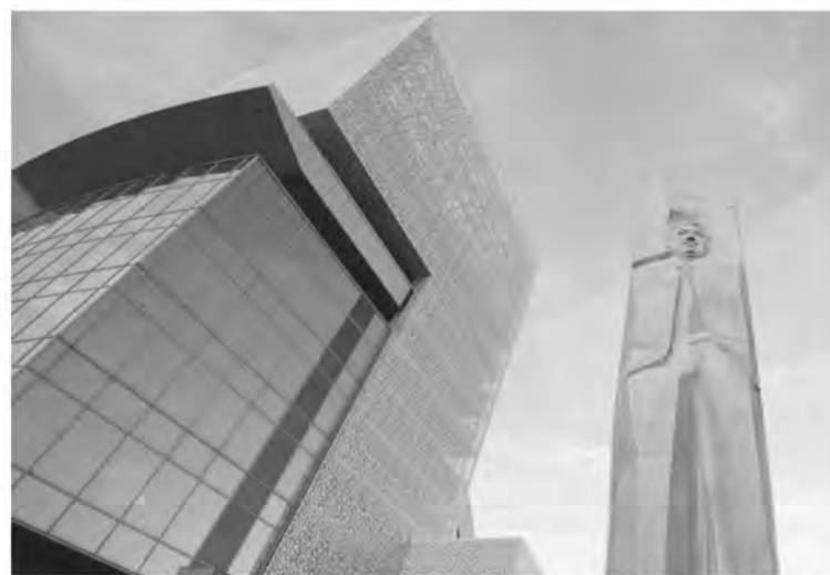
Работы по созданию центра велись с 2011 года. Сейчас это пятиэтажное здание многофункциональной направленности.