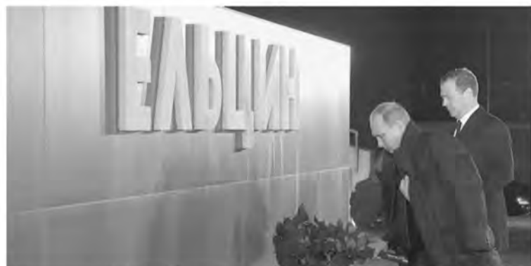
Владимир Путин и Дмитрий Медведев возложили цветы к памятнику первому российскому Президенту.