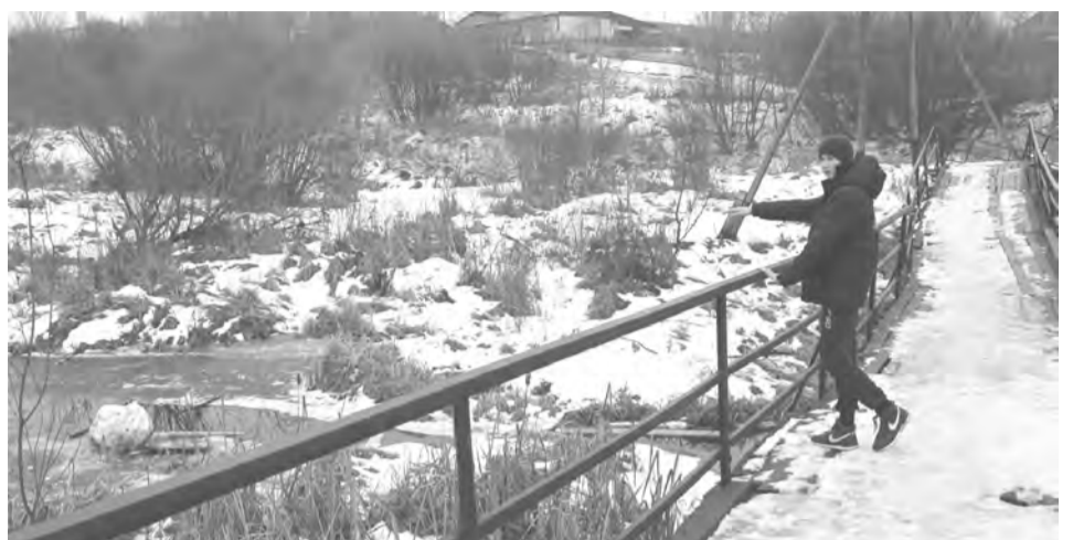
Пруд в д.Мохириевой, где удалось избежать беды