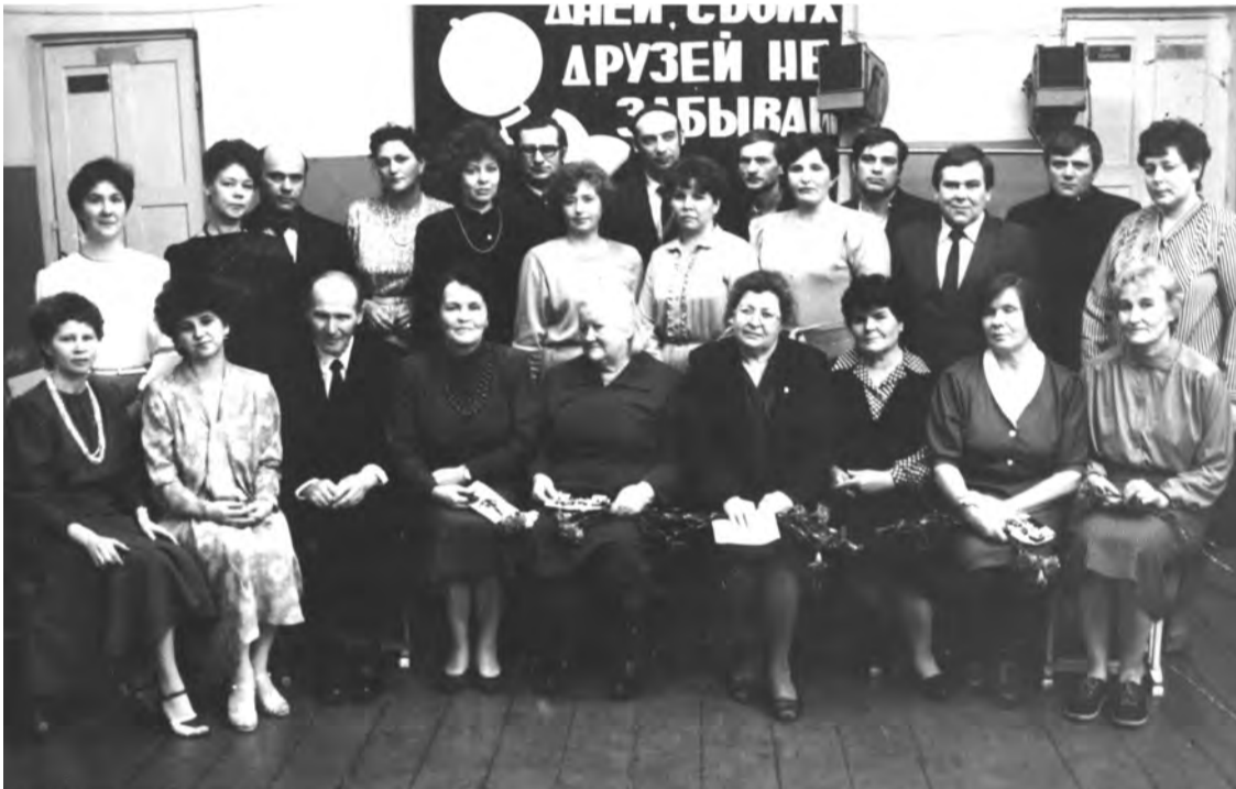
Выпуск 1969 года школы № 1, 10-а класс. Встреча 10 лет спустя. 1979 год.