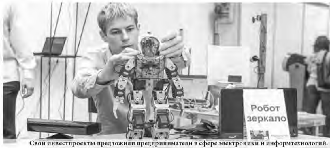
Свои инвестпроекты предложили предприниматели в сфере электроники и информтехнологий.