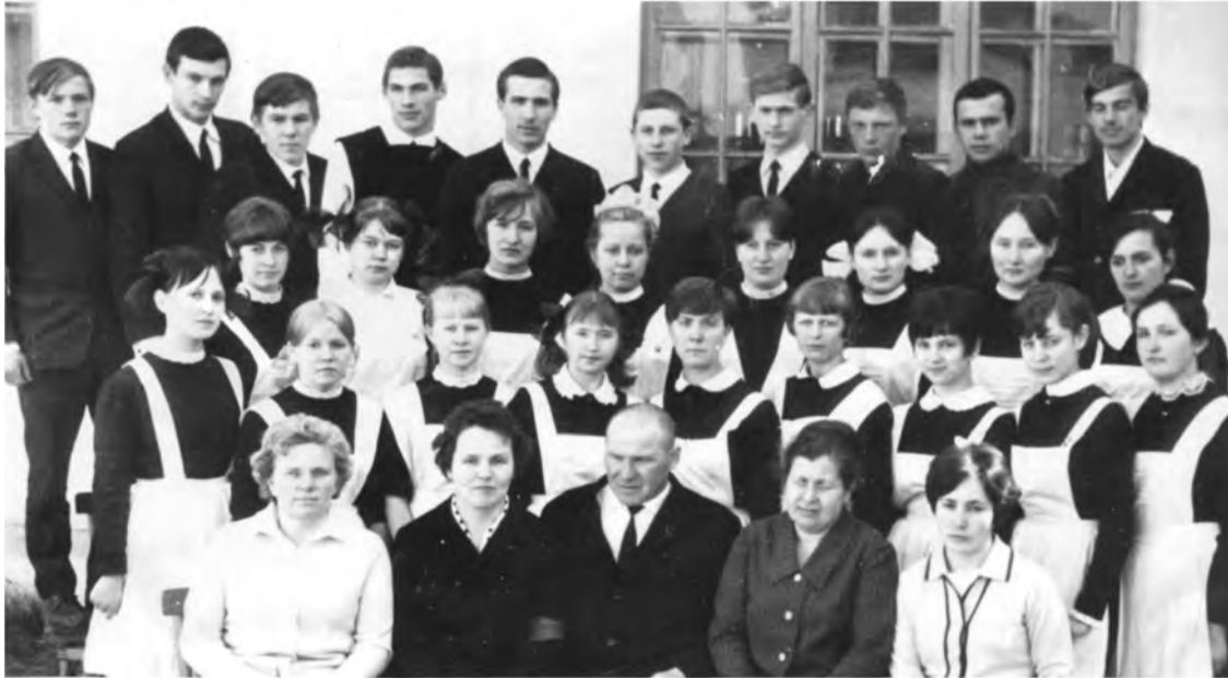
10-а класс школы № 1. Выпуск 1969 года. г. Талица.