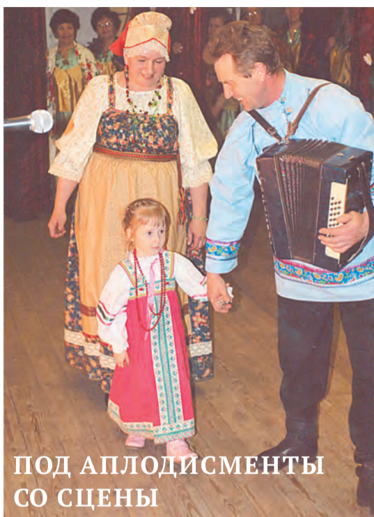
ПОД АПЛОДИСМЕНТЫ СО СЦЕНЫ