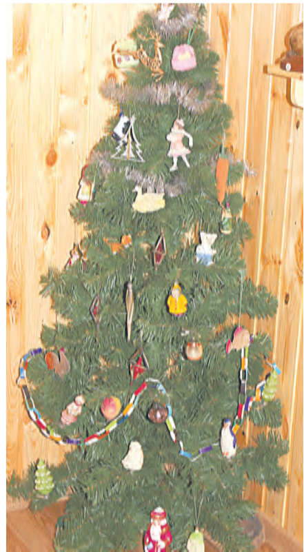
Ёлочка, украшенная игрушками из прошлого века

палочек. Все эти игрушки также представлены на нашей ретро-ёлочке.