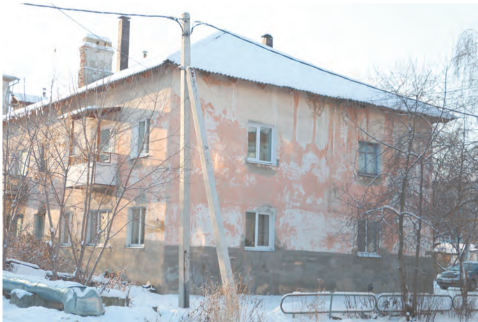
г. Талица, ул. Пушкина, 2-А. Капремонт этого дома назначен на 2015 год. Отремонтированы будут инженерные коммуникации, кровля, подвал и другие места общего пользования.

Уважаемые жители Талицкого городского округа!