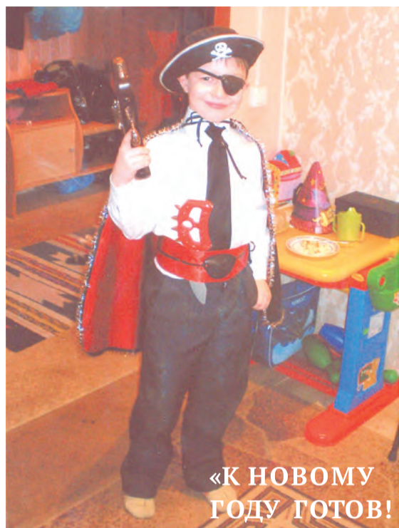
«К НОВОМУ ГОДУ ГОТОВ!»