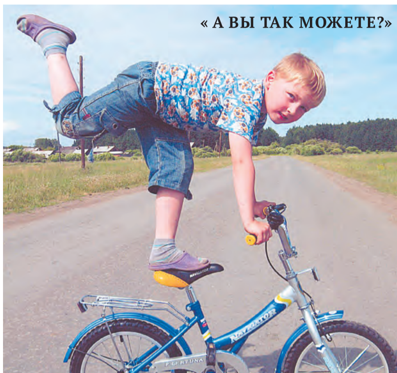
« А ВЫ ТАК МОЖЕТЕ? »