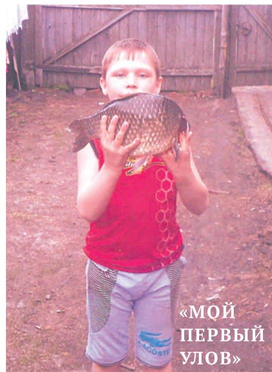
«МОЙ ПЕРВЫЙ УЛОВ»