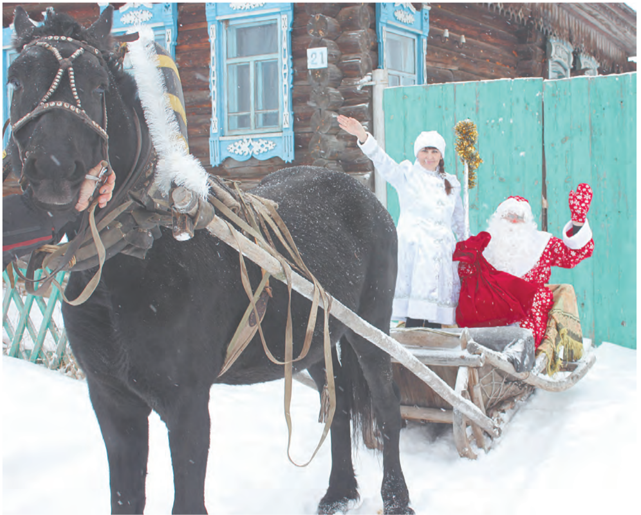
Мохирёвские Дед Мороз и Снегурочка желают всем счастья в Новом году